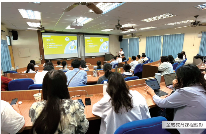
金融教育課程剪影