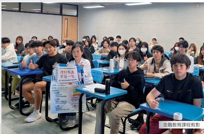
金融教育課程剪影