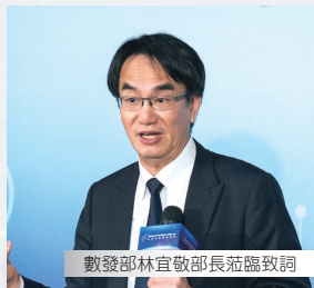
數發部林宜敬部長蒞臨致詞