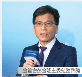
金管會彭金隆主委蒞臨致詞