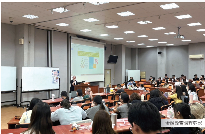
金融教育課程剪影