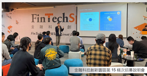
金融科技創新園區第 15 梯次招募說明會

本次說明會共吸引約 50 位產業及新創代表透過線上與實體方式參與。配合園區 2.0 分級輔導機制，本梯次招募開放金融科技新創、科技業者及資訊服務業者申請，受理至 4 月 15 日止，通過團隊預計於 115 年 7 月 1 日正式進駐。未來園區將持續引入多元創新能量，打造跨域合作平台，協助業者拓展金融應用場景、提升國際能見度，並進一步壯大金融科技生態系發展。