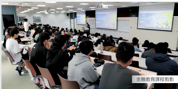
金融教育課程剪影

為提升年輕世代金融素養，本會推動「115 年大專院校金融教育課程計畫」，深入全台校園辦理實體理財課程，引導學生學習正確理財觀念，並透過理財遊戲練習財務目標設定、收支規劃、風險管理、投資組合等理財步驟。本計畫除了透過實體課程進行系統性學習外，還結合影音、競賽、社群等管道，延伸學習場域、提升知識傳播效益，期能協助學生學習理財必修知識、建立正確金融態度、養成良好財務行為，為未來生涯發展奠定穩健基石。