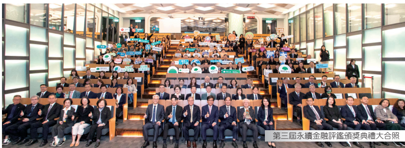
第三屆永續金融評鑑頒獎典禮大合照