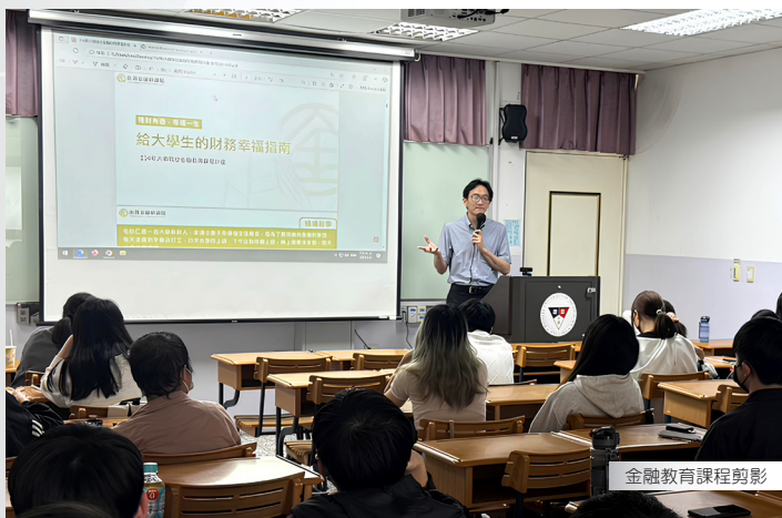
金融教育課程剪影