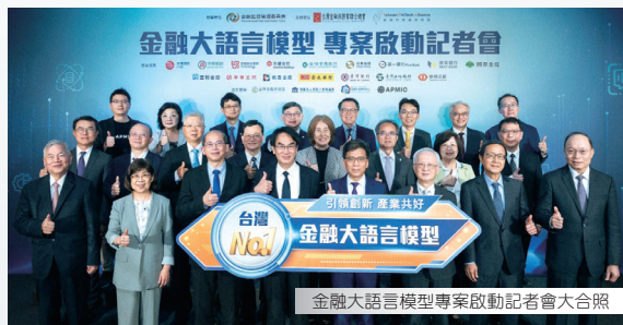
金融大語言模型專案啟動記者會大合照

彭主委亦表示，其本人前已率隊拜會國科會吳誠文主委，積極尋求跨部會協力支持。本次記者會國科會張執秘與數發部林部長親臨出席，充分體現政府對本計畫之高度重視。他並說明，金融大語言模型已正式納入國科會「AI新十大建設」計畫，數發部亦允諾提供主權AI相關資料庫作為模型訓練之用，彰顯本專案在政策層次獲得跨部會一致支持之重要意義。