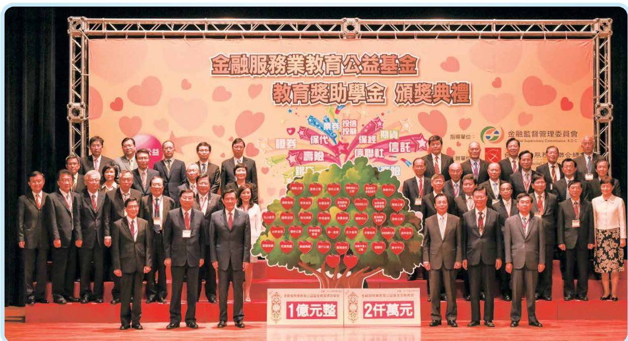
▲2015年5月28日馬英九總統、金管會曾銘宗主委、本會李述德理事長與各捐款單位代表出席「104年度金融服務業教育公益基金教育獎助學金頒獎典禮」合影。