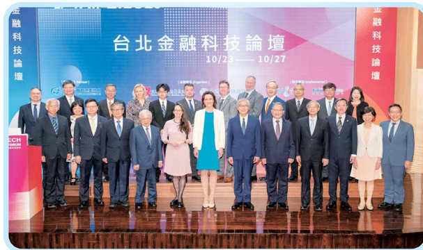
▲2023年10月25日「2023台北金融科技論壇」，金管會黃天牧主委、財政部阮清華政務次長、中央銀行嚴宗大副總裁與本會蘇建榮理事長等出席合影。