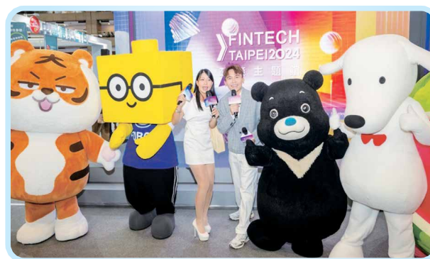
▲2024年擴大辦理博覽展