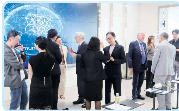
▲「FinTech 跨界創新交流會」新創團隊與金融從業人員深度交流