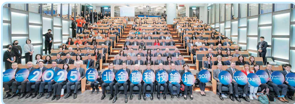
▲2025年10月22日「2025台北金融科技論壇」，金管會彭金隆主委與本會董瑞斌理事長等出席合影。

「人」是金融業至關重要的核心資產，不論是新技術的導入與運用，新商品的研發與精進，乃至於內部流程的改造與效能的提升，均需要有相應的人才配合，方能展現成效。因此，各界無不重視人才培育；而本會身為產業的代表，將人才培育視為己任，積極投入相關活動期全面提升金融從業人員職能及金融相關科系師生的科技素養。本會於2016年啟動「金融科技人才培育計畫」（下稱「本計畫」），迄今已培育逾12,000人次，為金融產業注入一批金融科技人才。