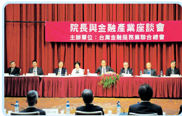
▲ 2016年12月22日行政院林全院長主持本會主辦之「院長與金融產業座談會」