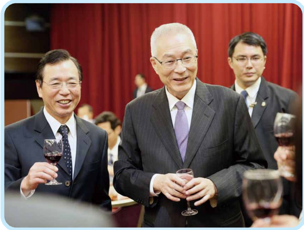
▲第4屆第3次會員大會 吳敦義副總統蒞臨致詞