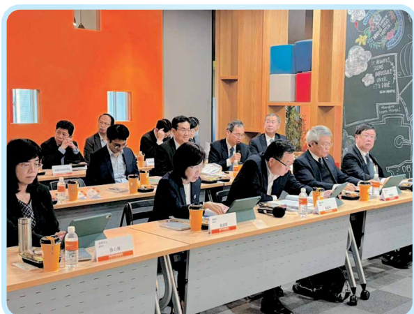
▲2025年12月2日第7屆第10次理監事聯席會議