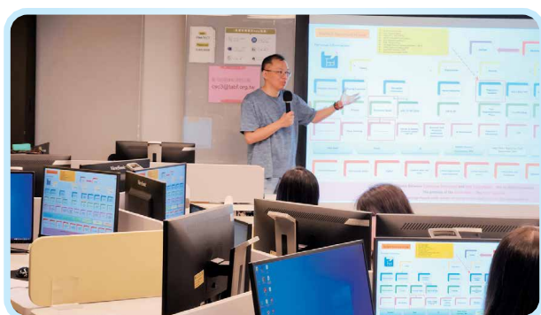
▲課程中講師進行實務分享