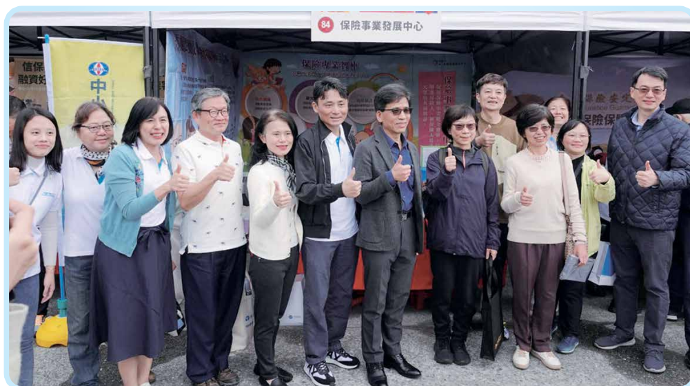
▲ 2024金融服務愛心嘉年華-金管會彭金隆主委及本會陳慧遊代理理事長與保發中心金融教育互動攤位合影。

保發中心在主管機關指導下，每年參與本會辦理的金融服務愛心公益嘉年華，設立互動式教育攤位，引導民眾學習正確的金融保險觀念及提升防詐意識。每場約3萬民眾參加。