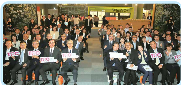
▲ 2021年3月17日金管會黃天牧主委與本會許璋瑤理事長出席監理科技黑客松頒獎典禮。

針對重要金融議題，結合媒體、主管機關與會員機構舉辦研討會或論壇，強化意見溝通，立足於整體金融服務業之宏觀角度凝聚共識，並形成政策建言。