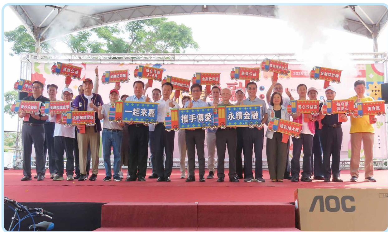
▲「2025年金融服務愛心公益嘉年華」(嘉義場)

本次活動以「金融知識」、「反詐宣導」與「公益關懷」為三大核心。金融教育區設置了超過90個攤位，涵蓋所有金融同業公會與金融周邊機構。由各單位精心設計的互動闖關遊戲，將複雜的金融知識轉化成人人易懂、人人能玩的體驗，從投保觀念、數位金融，到民眾最關心的反詐騙知識，都透過寓教於樂的方式深入每一位參與者的心中。