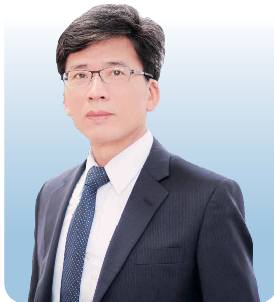
▲金管會主委 彭金隆博士

台灣金融服務業聯合總會（下稱金融總會）自2005年5月25日正式成立迄今，已屆滿二十載。欣見金融總會會務規模茁壯發展。金融總會作為金融業界的總平台，長年以來助力於整合銀行、證券、保險、信用合作社等各金融業與周邊單位的資源與力量，成為連結公私部門的重要橋樑，並協助政府深化各項金融政策的溝通與推動，更在深化普惠金融以及促進社會公益等方面扮演了關鍵角色，有效促進我國金融市場穩健、創新與永續發展。欣逢金融總會二十周年紀念專刊付梓，謹此致上最誠摯的祝賀與感謝。