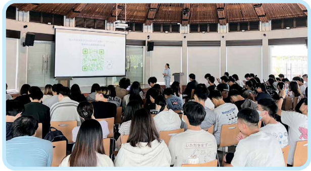
▲ 各領域講師走入校園，協助推動金融科技人才培育

期以《金融科技力》教學用書做為課程主架構，奠定入門知識體系；其後再將核心概念與各項金融科技議題改編為易於理解的影音形式，陸續製作逾 30支主題影片，內容涵蓋區塊鏈、數位支付、AI 應用、監理科技、資安等領域。影片於YouTube平台累計超過90萬次觀看，已成為學生自學的重要管道，也作為教師課堂補充教材，使教學更具彈性與延展性。