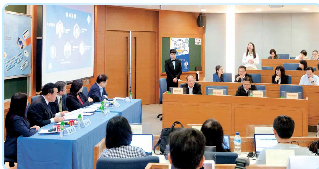
▲ 金融科技校園座談-政治大學場 (107年10月3日)

金融科技發展基金自成立以來，持續匯聚產業資源，從園區育成、展會論壇、人才培育到政策推動，累積穩健成果。在金管會指導下，基金致力整合資源、深化研發與國際鏈結，期望進一步提升金融服務的普惠性與效率，與產官學研各界共同打造更具競爭力的數位金融環境。