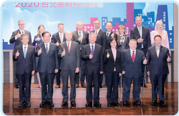
▲ 2020年10月30日「2020台北金融科技論壇」，行政院沈榮津副院長、金管會許永欽副主委、邱淑貞副主委與本會許瑋瑤理事長等出席合影。