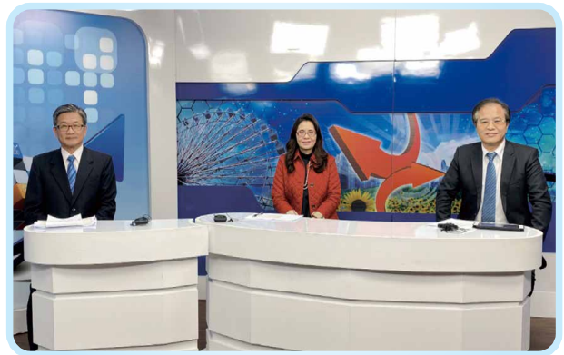
▲會基會錄製金融宣導影片

會基會自108年起每年舉辦金融科技趨勢研討會，主題緊密結合監理與市場脈動。從討論純網銀衝擊（108年）、保險業導入IFRS 17（109年），到聚焦ESG報告揭露準則（111年）；近年則強調數位安全與治理，舉辦「數位新經濟防詐大揭秘」論壇（112年），以及「合規的理財、稅務與洗錢防制」研討會（114年）。