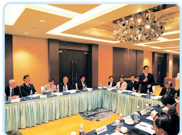
▲2016年6月27日第4屆第9次理監事聯席會議