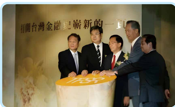
▲ 陳水扁總統、金管會龔照勝主委與本會鄭深池理事長參加本會成立大會（2005年5月25日）。