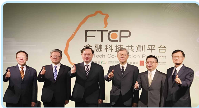
▲ 2020年11月19日舉辦「金融科技共創平台啟動儀式暨記者會」，金管會黃天牧主委與本會許璋瑤理事長等出席合影。

為兼顧人才、技術、制度與推廣面向，平台成立四個執行小組，各自承擔不同任務，形成互補與協作的推動能量：