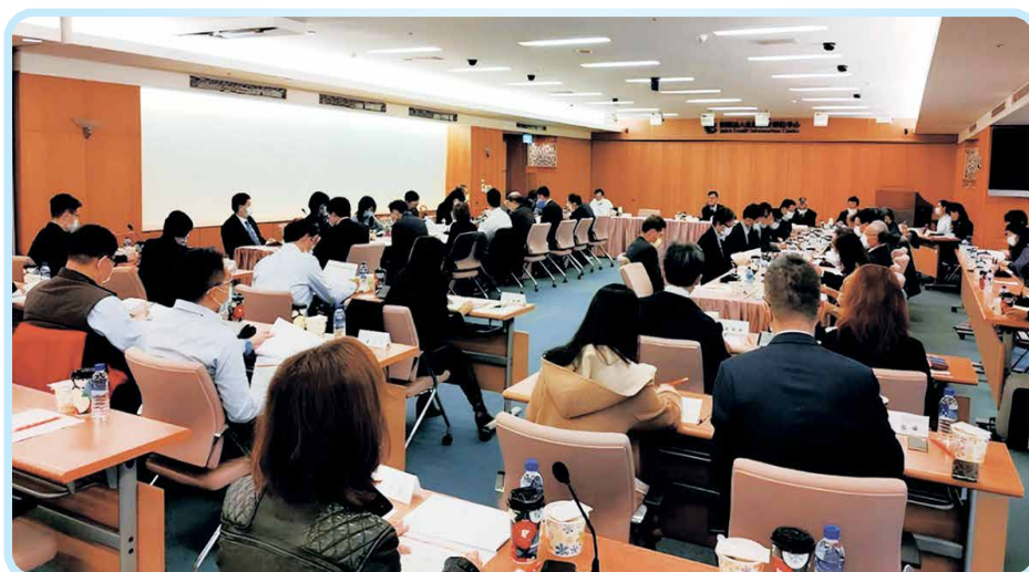
▲ 金融 FIDO聯盟成立大會 (110年5月4日)

數據治理組持續推動資料共享、資料分級管理、Fast-ID 與跨機構資料庫建置等重點工作，逐步形成支持創新落地的數據基礎。透過標準化與治理機制的建立，不僅提升市場資訊透明度，也降低資料交換成本，強化我國金融科技生態的長期競爭力。