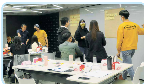
▲透過講師引導進行分組討論