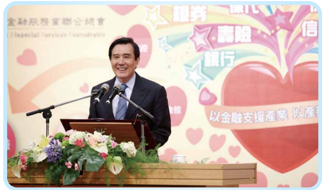
▲2016年12月22日「105年度金融服務業教育公益基金教育獎助學金頒獎典禮」馬英九總統蒞臨致詞

本會每年並舉辦獎助學金頒獎典禮。典禮邀請總統、金管會主委及各捐款機構高層出席，親自鼓勵身處逆境仍品學兼優的學子。典禮中安排學生代表分享如何運用獎助金專注學業，許多學生提及這筆資金讓他們能減輕打工負擔，全心投入跨領域學習或考取專業證照。這種「由金援到教育」的模式，成功為弱勢學子建構了翻轉未來的階梯。