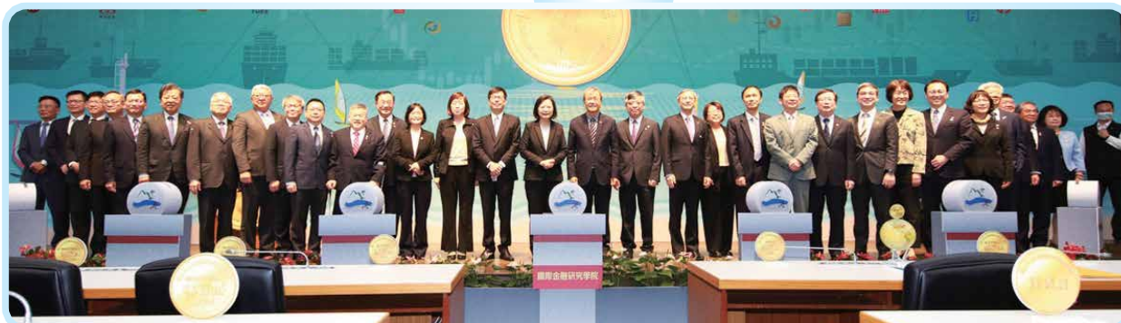
▲ 2022年3月4日蔡英文總統與本會許璋瑤理事長參加中山大學舉辦「國際金融學院」揭牌儀式。