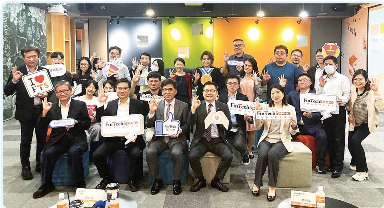
▲2024年11月14日金管會彭金隆主委與新創有約（第三場），彭主委蒞臨指導，並與本會吳當傑秘書長等出席人員合影。