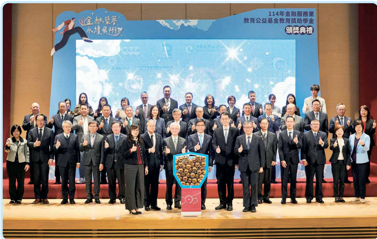
▲2025年12月16日金管會彭金隆主委、本會董瑞斌理事長與各捐款單位代表出席「114年度金融服務業教育公益基金教育獎助學金頒獎典禮」合影。

除了資金補助，本基金亦結合「金融教育」推廣，鼓勵受獎生參與基礎金融素養課程，提升職場競爭力。2025年，本會更榮獲金管會頒發「金融教育貢獻獎—最佳協力獎」銅質獎肯定，彰顯本會在公益與教育結合上的卓越成效。未來，本會將持續發揮產業影響力，將愛心轉化為台灣社會前進的穩健力量。