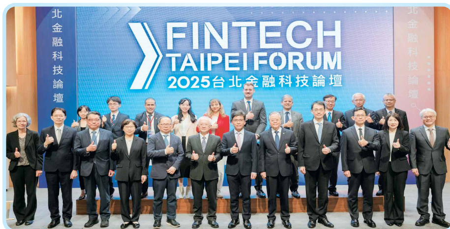
▲2025年10月22日「2025台北金融科技論壇」，金管會彭金隆主委與本會董瑞斌理事長等出席合影。

評估與永續轉型中的新興需求。整體而言，FinTech Taipei 不僅作為政策的宣導與交流場域，更透過論壇、展示與國際合作，使監理方向、產業需求與技術供應得以整合，形成台灣金融科技生態的共同語言。