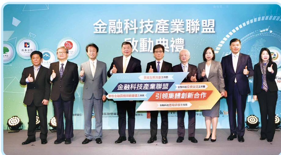
▲ TFA在金管會彭金隆主委與本會董瑞斌理事長等見證下正式成立 (114年2月19日)