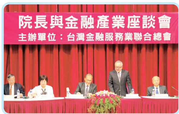
▲ 2016年12月22日本會施俊吉理事長於「院長與金融產業座談會」致詞，行政院林全院長、金管會李瑞倉主委、國發會陳添枝主委、行政院 陳美伶秘書長出席。

金融建言白皮書採產官學研專家之專業意見看法，觀察國際金融環境後，再評析考量所研擬之戰略規劃，以及各金融公會反映於執行業務及市場發展關切之議題。整體內容架構編排上，白皮書以金融服務業對社會貢獻作為引言報告，包括總體經濟環境、實