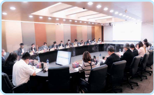
▲專家會議共同討論認證機制