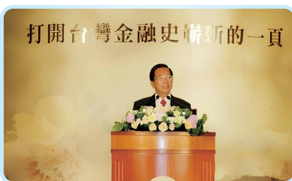
▲ 2005年5月25日陳水扁總統出席本會成立大會致詞。