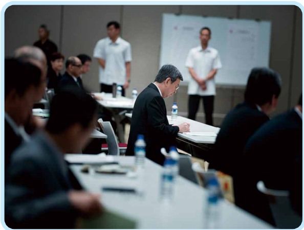
▲第5屆第1次會員大會 陳建仁副總統蒞臨致詞