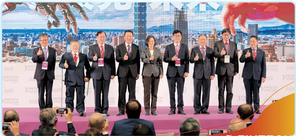
▲2019年蔡英文總統親臨FinTech Taipei會展，並與行政院陳其邁副院長、金管會顧立雄主委、本會許璋瑤理事長等合影。

促成 27 場跨國媒合，包括來自新加坡、馬來西亞的創投單位。另有16位媒體記者出席，共 31 則國內報導與 22 則國際曝光，使FinTech Taipei 在國際舞台的能見度更為明確。