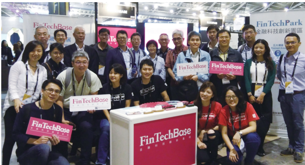
金融科技前瞻高峰會暨創新創意資源展